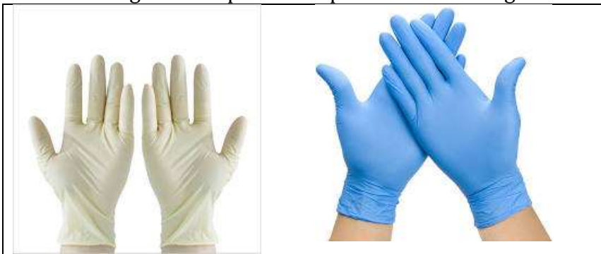
GUANTI NON STERILI

I guanti di protezione, generalmente in nitrile, lattice o latex free per i soggetti allergici, li distinguiamo grossolanamente in sterili e non sterili. I primi sono dedicati all'esecuzione di manovre che richiedono una condizione di sterilità, mentre i non sterili vengono impiegati per il controllo delle condizioni cliniche dell'infortunato o la sua movimentazione. È consigliabile in ogni caso adottare la tecnica del doppio guanto (doppio non sterile, sterile su non sterile), per aumentare il gradiente protettivo personale e verso gli altri.